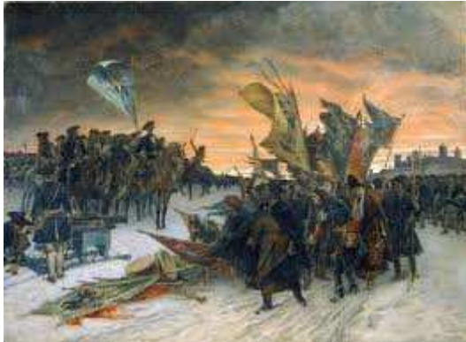
Svensk seger vid Narva.

Sverige för Routsii som också betyder Ryssland. Han blev mig inte svaret länge skyldig: "det är samma nation, samma folk", svarade han kvickt och en urfinne med historiantresse borde veta. Att förekomna stridigheter ej endast handlat om " dominium maris Baltici " hade i allt väsentligt undgått min bedömning.