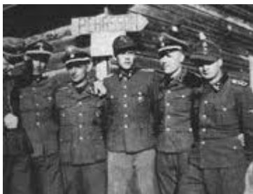
Svenska volontärer med Wehrmacht i Ukraina 1941.